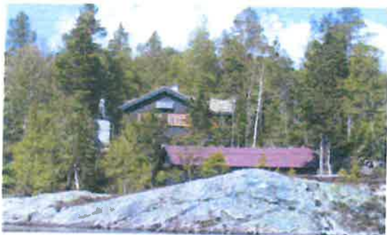
O.H.Garberg sin hytte fra 1936 er erstattet av en ny hytte på den samme tomte. Deler av den gamle hytta står fortsatt.