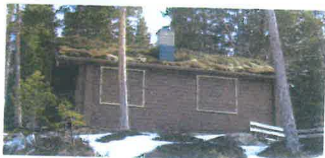
Westerhus sin hytte innerst i Øyingen ved Kveldvedtangen.