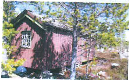
Vollan sin hytte, nå Aas. Her foregår det bygging av ny hytte.