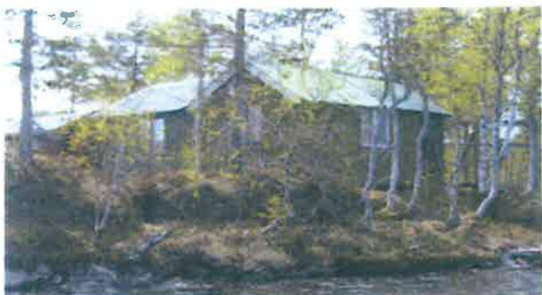
"Vikranhytta" ble satt opp på Hyttøya på 40-tallet, nå Finstad.