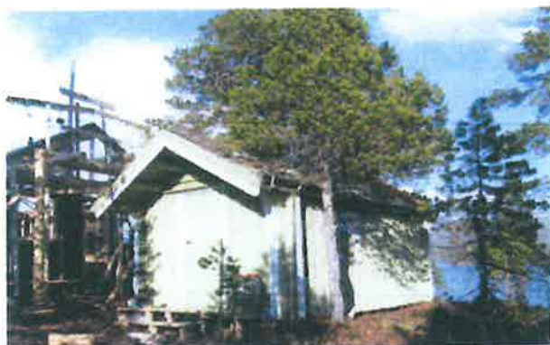
Skjerve: Her er det igangsatt arbeid med å bygge en ny hytte på den opprinnelige tomte.