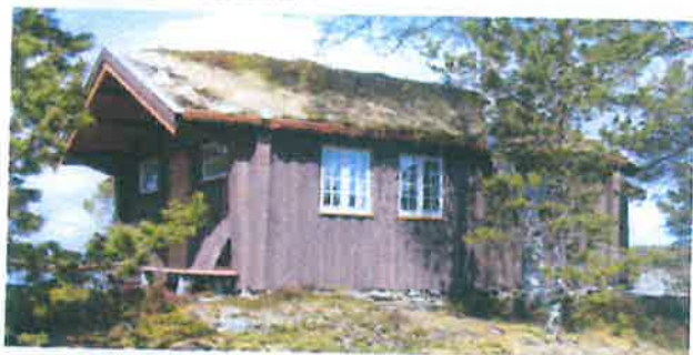
Lund sin hytte som ligger på Bjønnøya.