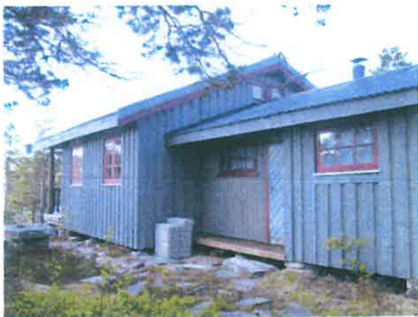
Myhr sin hytte: Den opprinnelige hytta er utvidet med et påbygg.